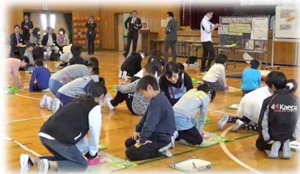
公開授業の様子(昨年度)